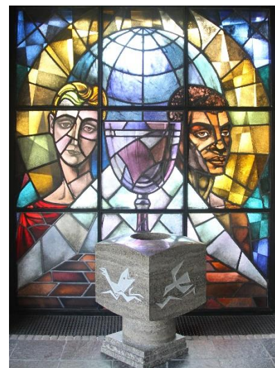
Op de voorgrond het doopvont uit de Brugkerk

Het glaswerk van het raam naast het orgel is opgebouwd met brokken gekleurd glas gevat in loodstrippen, in zijn totaal weergevende een groot kruis,